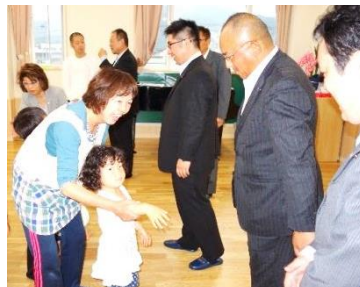
児童一人一人と握手するロータリアン