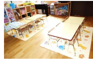
保育園に寄贈した椅子や机などの一部