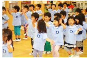
歌や踊りで感謝している。