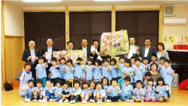
おひさま保育園児童と理事長、広島城南 RC と仙台南 RC の皆さん