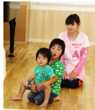
大人の男性達が多くて心配したのか、、、妹を抱きかかえるお兄ちゃん