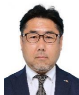
(株)萩野工務店 代表取締役社長 (総合)建設業