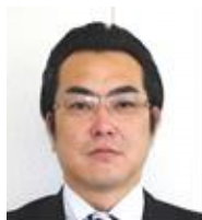
㈱橋本店 代表取締役社長 ((総合)建設業)

会員同士の関係をはぐくみ、積極的な会員増強計画を実行して、活気あるクラブづくりを行うことが出来るよう努めます。