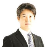
(株)青葉環境保全 代表取締役 (環境保全)

わが仙台南ロータリークラブが創立70周年という輝かしい節目を迎えるにあたり、国際奉仕委員長の大役を拝命いたしましたことを大変名誉に感じております。