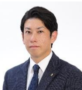
社会保険労務士法人 めぐみ事務所 代表社員