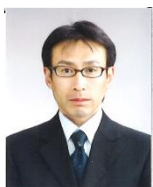
(株)日新 取締役副社長 (広告業)

「職業奉仕」と聞くと少し難しく考えてしまいますが、「自らの仕事に責任を持ち、その仕事を通じて周りの人を笑顔にすること」だと個人的には思っています。我がクラブには、それぞれの分野で第一線を走る素晴らしいプロフェッショナルが集まっています。